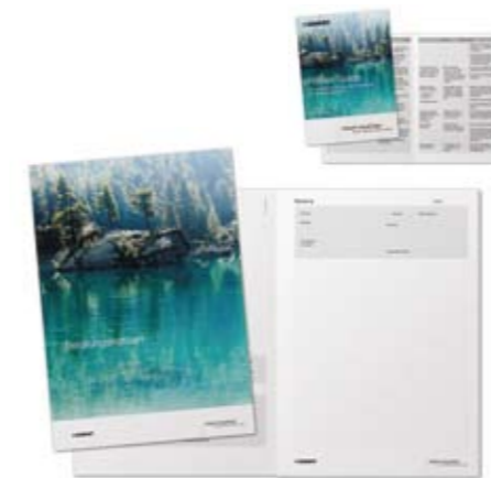
Beratungsblock im Look der Kampagne und praktischer Pocket Guide als Leitfaden für erfolgreiche Kundengespräche.