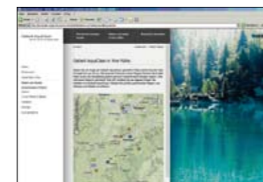
Prominente Platzierung der Geberit AquaClean Partner auf der Website www.i-love-water.de