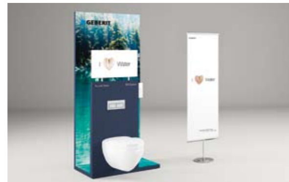
Modulares POS-System in drei Größen mit Produktexponaten, Rollup, Broschürensteller und optionalem Flachbildschirm.

als Wohlfühlprodukt zur Steigerung der Lebensqualität vorgestellt. Als Partner von Geberit AquaClean punkten Sie dank kampagnenaher, ansprechender Ausstattung für Ihre Ausstellungsräume und Schaufenster mit Wiedererkennungswert und sichern sich starke Verkaufsargumente.