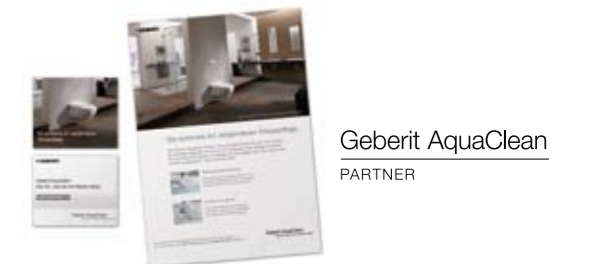
Banner, Anzeigenvorlagen sowie Bilder und Partner-Logo zum Herunterladen.