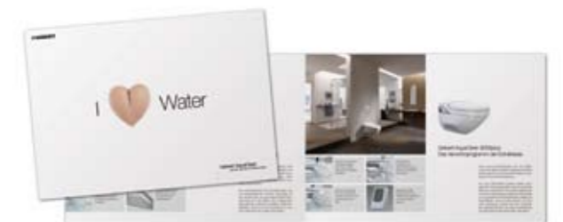
Geberit AquaClean Broschüren laden den Kunden zum Vertiefen ein.